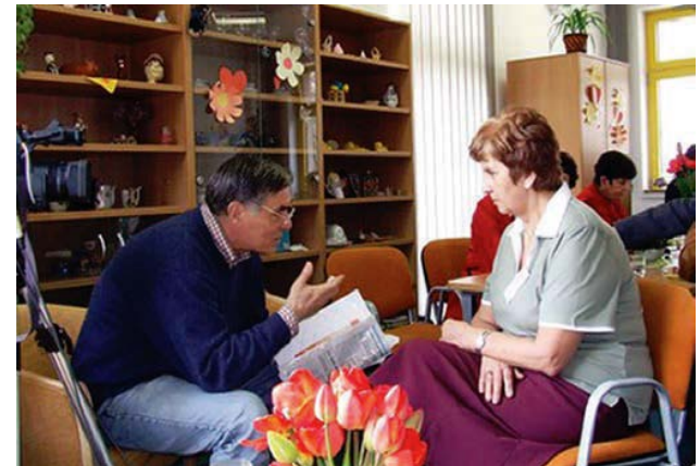
„Vzdělávání a trénink seniorů“ Centrum vizualizace a interaktivity ve vzdělávání, s. r. o.